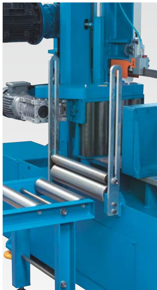
Стабильные роликовые направляющие и подача материала для набора обрабатываемых деталей