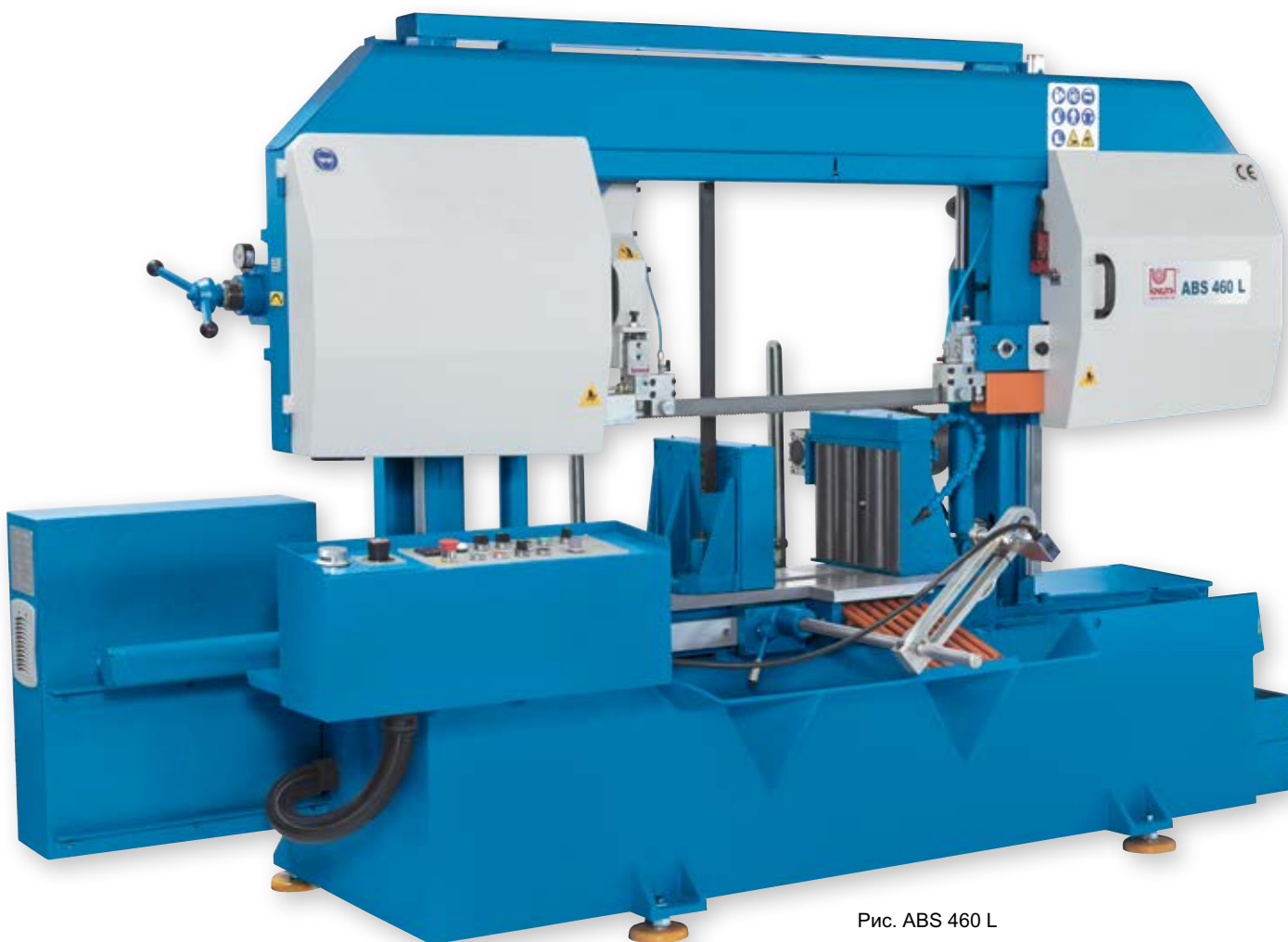
Рис. ABS 460 L