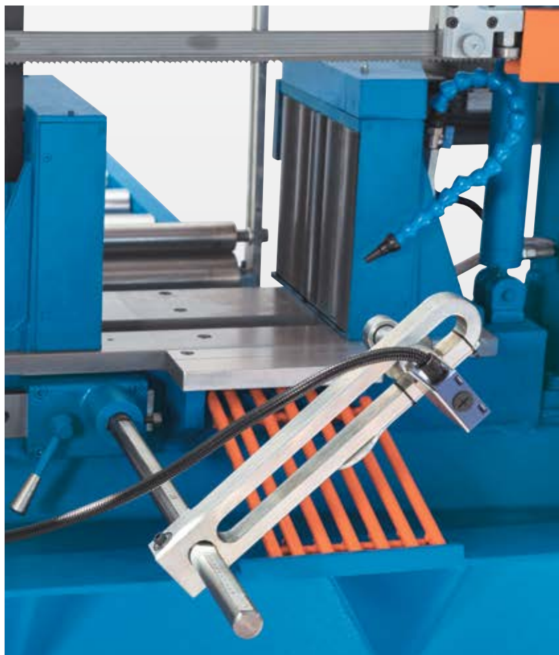
Приводные подающие ролики автоматически останавливаются при окончании материала