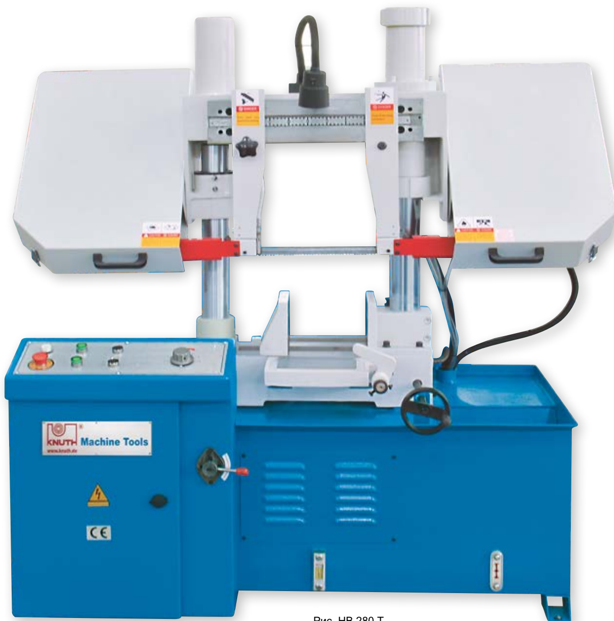
Рис. НВ 280 Т