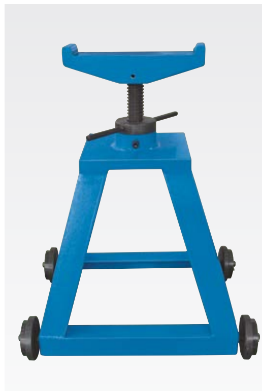
Стойка для опоры заготовки — только для НВ 280 Т