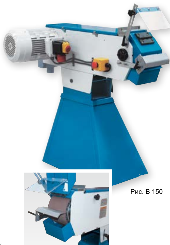
Рис. B 150