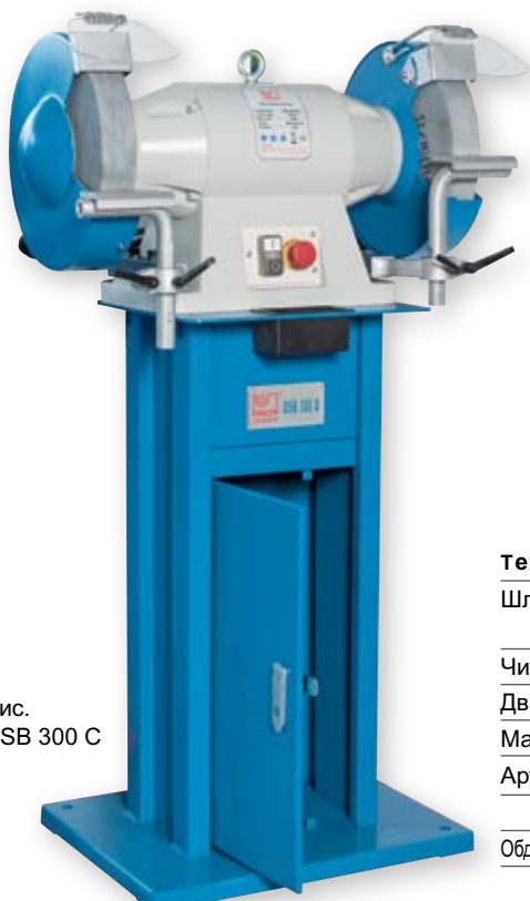
Рис. DSB 300 C

Устойчивые двухсторонние шлифовальные станки для ремесленников и промышленных предприятий