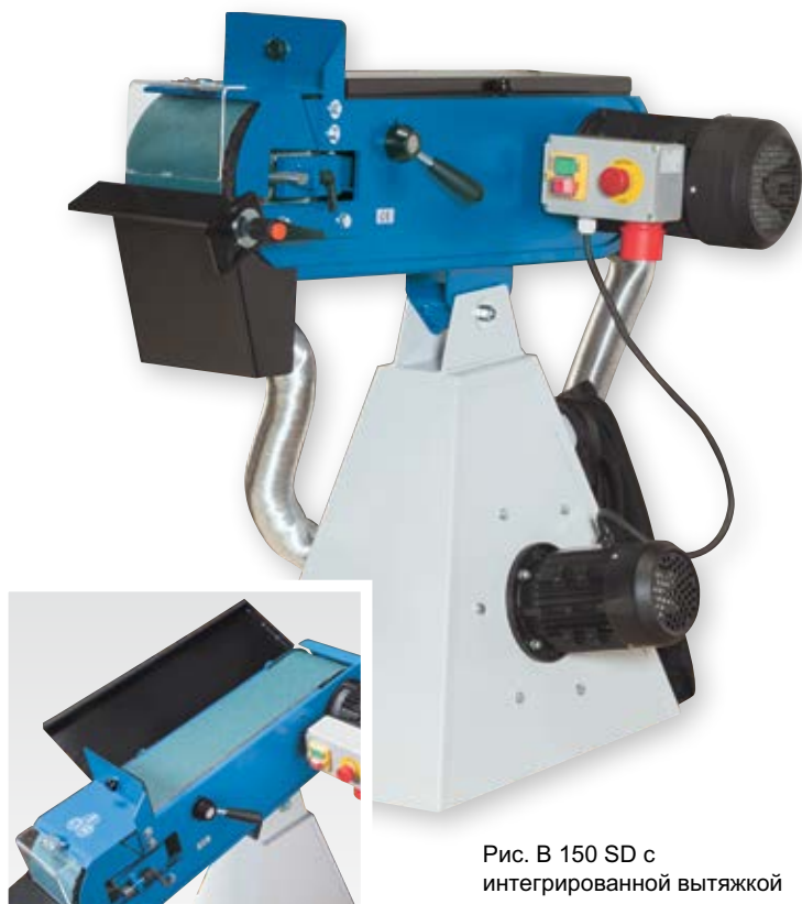
Рис. B 150 SD с интегрированной вытяжкой

Большая обрабатываемая поверхность с фиксированным упором